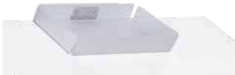
SCHREIBZEUGSCHALE FÜR GE UND GD Beliebig am Tisch ansteckbar Schreibzeugschale Aluminium eloxiert optimal bei Schrägstellung: 250 x 140 x 90 mm (B x T x H)