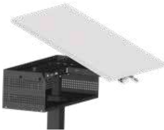
STUFENLOSE SCHRÄGSTELLUNG Standard 0° bis 23° optional: 0° bis 80°