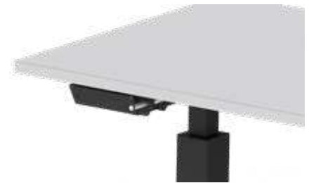
MAPPENHAKEN beidseitig montierbar und einschiebbar