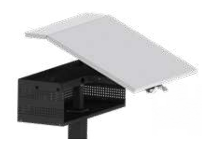
STUFENLOSE SCHRÄGSTELLUNG MIT 2-TEILIGEM TISCHBLATT Standard 0° bis 23°