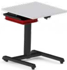
BOXENAUFNAHME 300 x 200 x 115 mm (B x T x H)