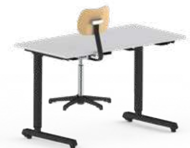
STUHLAUFHÄNGUNG für optimale und effiziente Reinigung