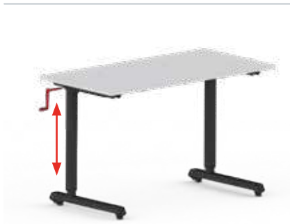
SCHNELLHUB-KURBELTRIEB 16 mm Hub pro Umdrehung