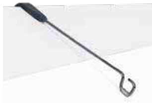
BLATTHALTER FÜR GE UND GD Blatthalter ansteckbar, optimal bei Schrägstellung