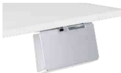
SCHREIBZEUGSCHALE FÜR GE UND GD Am Tischblatt fest montiert und abklappbar Schreibzeugschale Aluminium eloxiert optimal bei Schrägstellung: 250 x 140 x 90 mm (B x T x H)