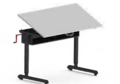
STUFENLOSE SCHRÄGSTELLUNG Standard 0° bis 23° optional: 0° bis 80°