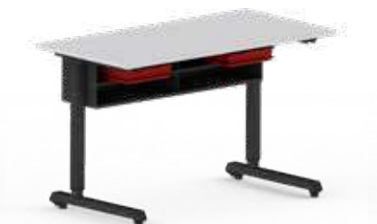
BOXENAUFNAHME-ABLAGE KOMBINIERT Boxenaufnahme kann mit Einfach- und Doppelablage kombiniert werden