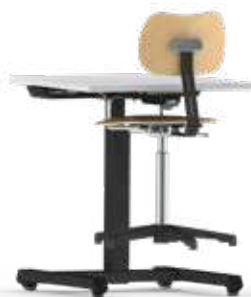
STUHLAUFHÄNGUNG für optimale und effiziente Reinigung