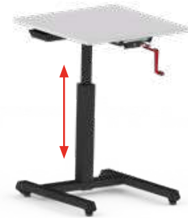
SCHNELLHUB-KURBELTRIEB 16 mm Hub pro Umdrehung