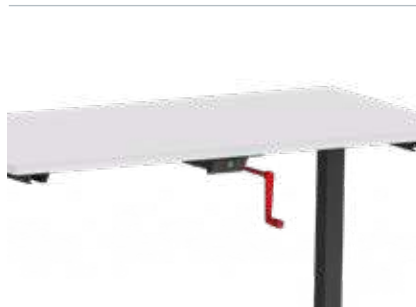
KURBELTRIEB VORNE Die Kurbel für den Kurbeltrieb kann optional auch vorne angebracht werden