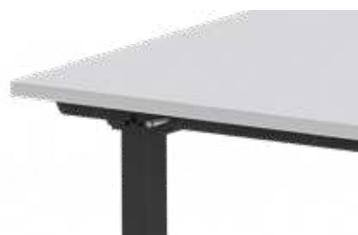
MAPPENHAKEN beidseitig montierbar und einschiebbar