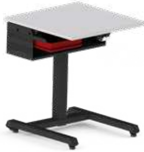
BOXENAUFNAHME MIT ABLAGE KOMBINIERT kann mit Einfach- und Doppelablage kombiniert werden