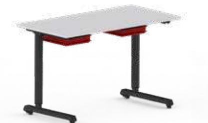
BOXENAUFNAHME 300x200x115 mm (B x T x H)