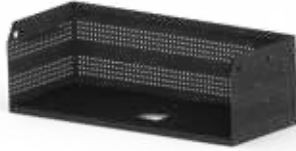
ABLAGE ZU EINZELTISCH GE Stahlblech pulverbeschichtet Modell GE Einzelablage 640 x 250 x 150 mm (B x T x H) Innenmass