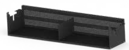
ABLAGE ZU DOPPELTISCH GD Stahlblech pulverbeschichtet Modell GD Einzelablage 1030x250x150 mm (B x T x H) Innenmass

Weitere Optionen zum Doppeltisch Genius befinden sich auch auf Seite 007