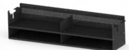
ABLAGE ZU DOPPELTISCH GD Stahlblech pulverbeschichtet Modell GD Doppelablage 1030x250x200 mm (B x T x H) Innenmass