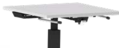
STUHLAUFHÄNGUNG einklappbar für Beinfreiheit

Weitere Optionen zum Einzeltisch Genius befinden sich auch auf Seite 007