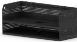
ABLAGE ZU EINZELTISCH GE Stahlblech pulverbeschichtet Modell GE Doppelablage 640 x 250 x 200 mm (B x T x H) Innenmass