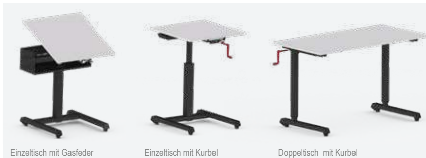
Einzeltisch mit Gasfeder

Ein Modell, sehr viele Möglichkeiten. Dank der hohen Modularität, können die verschiedenen Optionen einfach miteinander kombiniert werden, ohne dass die Funktionalität oder das Design beeinträchtigt werden. Die einzigartige Konstruktion ermöglicht, den Einzeltisch entweder mit Gasfeder- oder Kurbelhöhenverstellung auszustatten. Für jedes Modell stehen drei Tischhöhe für die Unter-, Mittel- und Oberstufe/Erwachsenenbildung zur Verfügung. Sie sind konzipiert für die Benutzung vom Sitzen bis zum Stehen.