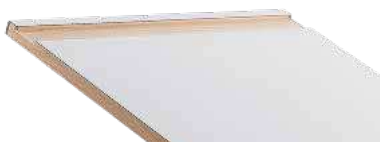
BLEISTIFTRILLE FÜR GE UND GD 6 cm breit und 1 cm tief