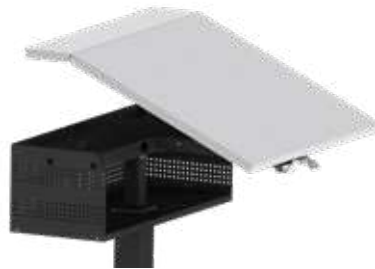
STUFENLOSE SCHRÄGSTELLUNG MIT 2-TEILIGEM TISCHBLATT Standard 0° bis 23°