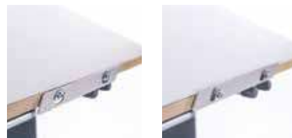
ANSCHLAGLEISTE FÜR GE UND GD Anschlagleiste Aluminium eloxiert, hochgestellt, tiefgestellt