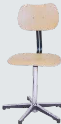
Stuhlmodell JOY mit Rollen und Sitzpolster

Wir empfehlen die Kombination unseres neuen Einzel- oder Doppeltisch Genius mit dem neuen Stuhlmodell JOY. Damit sind Sie ergonomisch in vielseitiger Hinsicht ideal für eine gesunde Arbeitsumgebung ausgestattet.