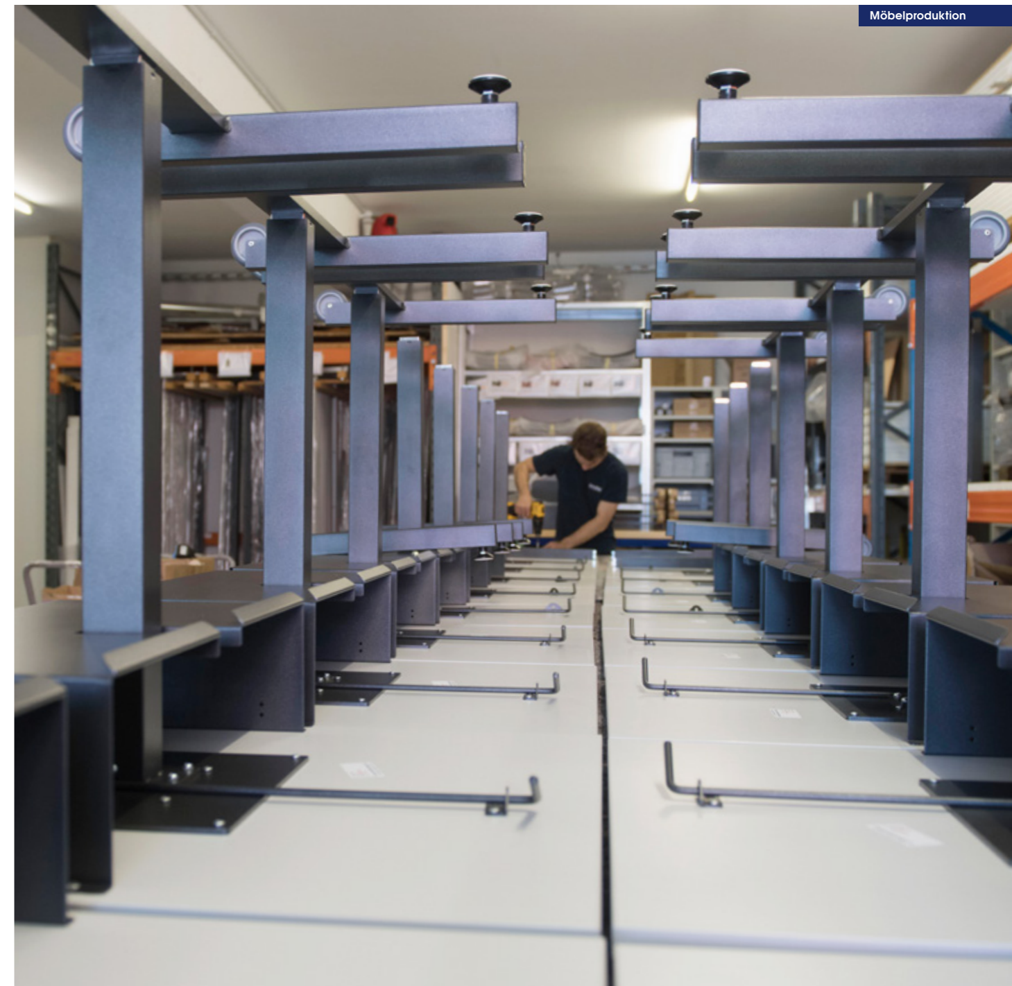
Unsere eigens produzierten bzw. konzipierten Knobel Schulmöbel sind Qualitätsmöbel mit funktionalem Design.